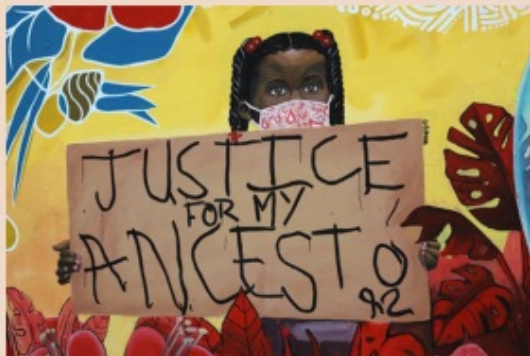
Bay Area Mural Program